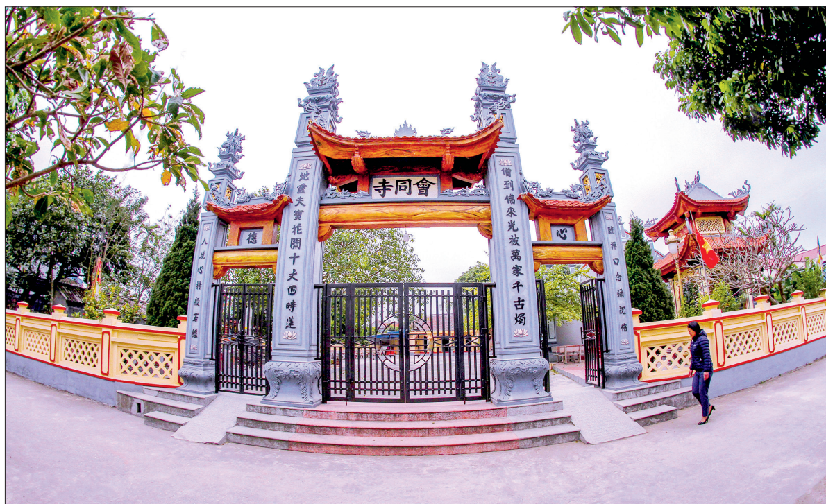
Cụm đền chùa Mẫu, thôn Tam Đường, xã Tiến Đức (Hưng Hà), nơi thờ công chúa Huyền Trân mới được tôn tạo.