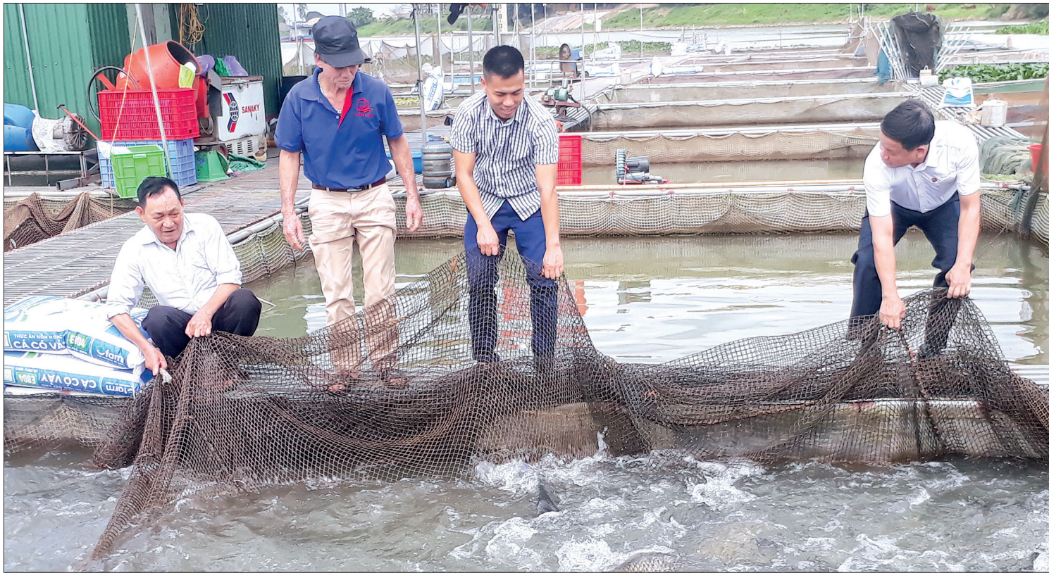
Nuôi cá lồng ở Điệp Nông (Hung Hà).