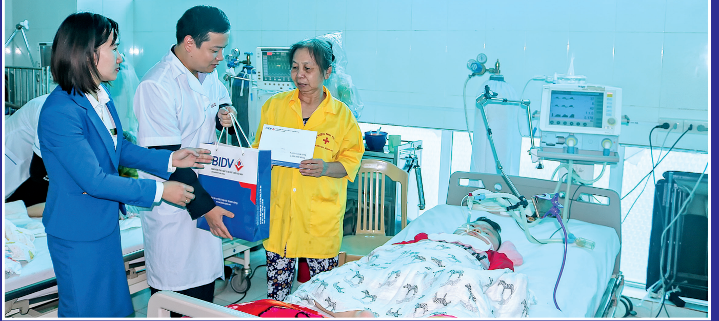
Tặng quà bệnh nhân có hoàn cảnh khó khăn tại Bệnh viện Nhi Thái Bình.

Tết với mọi người, đó là phút giây ấm áp quây quần bên những người thân yêu sau một năm làm việc vất vả. Thế nhưng, với người mắc bệnh trọng thì lại khác, có nhiều người chưa thể về nhà đón tết mà phải nằm lại bệnh viện để điều trị. Chia sẻ, động viên người bệnh, các bệnh viện đã tổ chức nhiều hoạt động ý nghĩa như: thăm hỏi, tặng quà, gói bánh chưng... vào dịp năm mới.