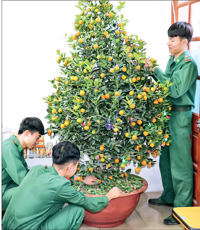
Chiến sĩ trẻ Bộ Chỉ huy Bộ đội Biên phòng tỉnh chuẩn bị đón tết.

Khi những lộc non của cây cối trong khuôn viên Bộ CHQS tỉnh hé mở cũng là lúc cán bộ, chiến sĩ trong đơn vị đang ra sức chuẩn bị mọi mặt để đón tết Nguyên đán Tân Sửu. Từ hệ thống pa nô, áp phích đến vườn cây, phòng truyền thống... đều được cán bộ,