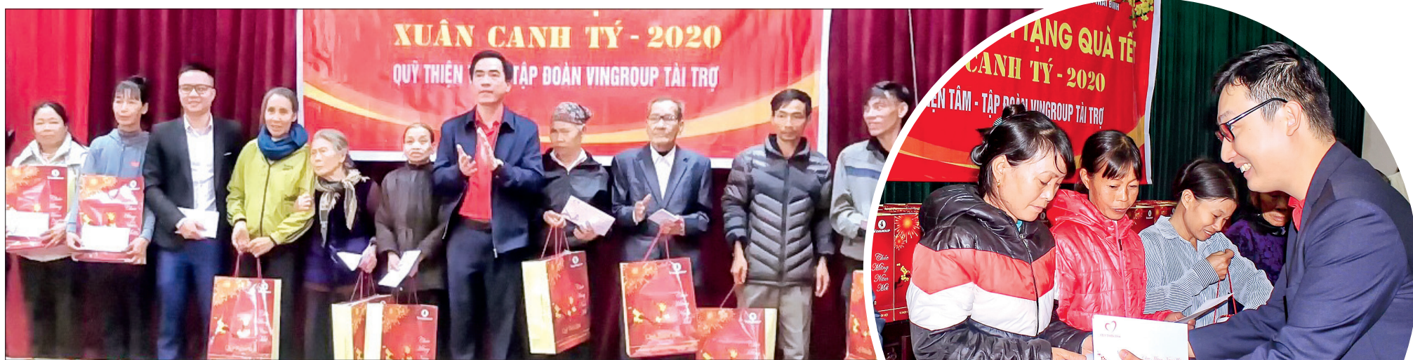
Đại diện Hội Chữ thập đỏ tỉnh và Quỹ Thiện tâm, Tập đoàn Vingroup trao quà tết cho người nghèo và nạn nhân chất độc da cam huyện Vũ Thư.