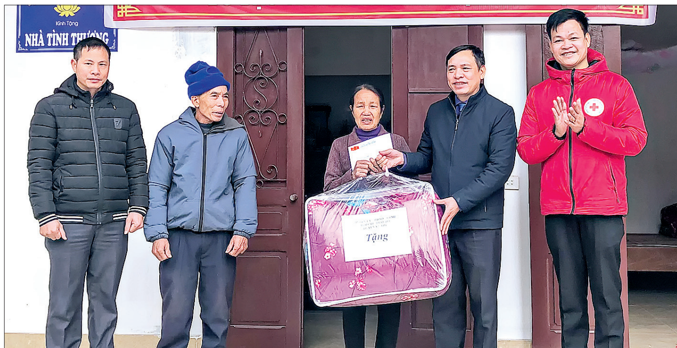
Lễ bàn giao nhà tình thương cho hộ nghèo huyện Vũ Thư nhân dịp tết Nguyên đán Tân Sửu 2021.

Tết Nguyên đán đến gần. Trong khi người người, nhà nhà tất bật sắm sửa chuẩn bị đón xuân mới thì vẫn còn đó nhiều mảnh đời kém may mắn, hàng ngày bươn chải lo mưu sinh. Với mong muốn mọi người, mọi nhà đều có tết, các cấp, các ngành trong tỉnh đã triển khai nhiều hoạt động thiết thực, chung tay mang tết đến với người nghèo, đối tượng chính sách, người có công.