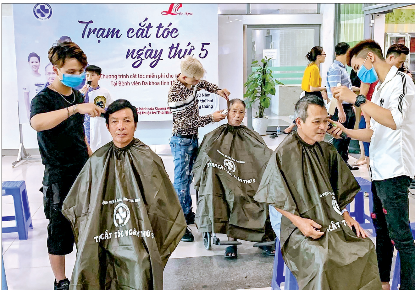
Bệnh nhân điều trị tại Bệnh viện Đa khoa tỉnh được cắt tóc miễn phí.

Một mùa xuân mới lại về khắp các nẻo đường. Tại bệnh viện, những bác sĩ sẵn sàng gác lại niềm vui riêng để mang lại niềm vui cho người bệnh. Đối với họ, sự sống của người bệnh chính là mùa xuân đẹp nhất, để mỗi giường bệnh luôn có mùa xuân yêu thương. Còn với những người bệnh, sự quan tâm, chăm sóc, hỗ trợ kịp thời từ cộng đồng sẽ là liều thuốc tinh thần quý giá để họ quên đi nỗi đau bệnh tật, hoàn cảnh mà vươn lên.