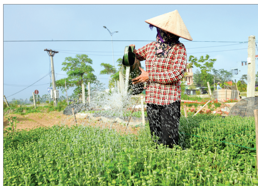
Phụ nữ xã Vũ Chính (thành phố Thái Bình) chăm sóc hoa, cây cảnh.