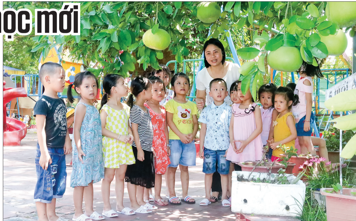
Cô giáo Trường Mầm non thị trấn Diêm Điền (Thái Thụy) giới thiệu cho trẻ về quả bưởi.

Thị trấn Diêm Điền là đơn vị đầu tiên của huyện Thái Thụy thực hiện sáp nhập Trường Mầm non thị trấn Diêm Điền vào Trường Mầm non thị trấn Diêm Điền. Ở thời điểm trước khi sáp nhập, nhà trường không những thiếu phòng học, phòng chức năng mà ngay cả hiệu trưởng, hiệu phó và các cô giáo của nhà trường cũng phải dùng chung một phòng với diện tích khoảng 20m 2 vừa là nơi để họp vừa là nơi để sinh hoạt hiệu bộ. Trong khi đó, Trường Mầm non tháng Tám có khuôn viên rộng, đủ phòng học, phòng chức năng, phòng hiệu bộ. Để việc sáp nhập bảo đảm chất lượng giáo dục, nhà trường đã mở thêm 2 phòng học để dẫn mặt độ học sinh ở Trường Mầm non thị trấn Diêm Điền. Một khó khăn lớn của thị trấn Diêm Điền nữa đó là khi có 2 trường mầm non với 3 điểm trường trên cùng địa bàn sẽ khó khăn trong công