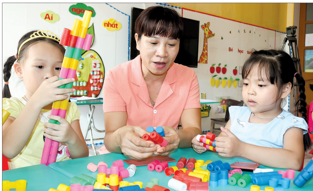
Cô và trò Trường Mầm non thị trấn Thanh Nê (Kiến Xương) tham gia các hoạt động.