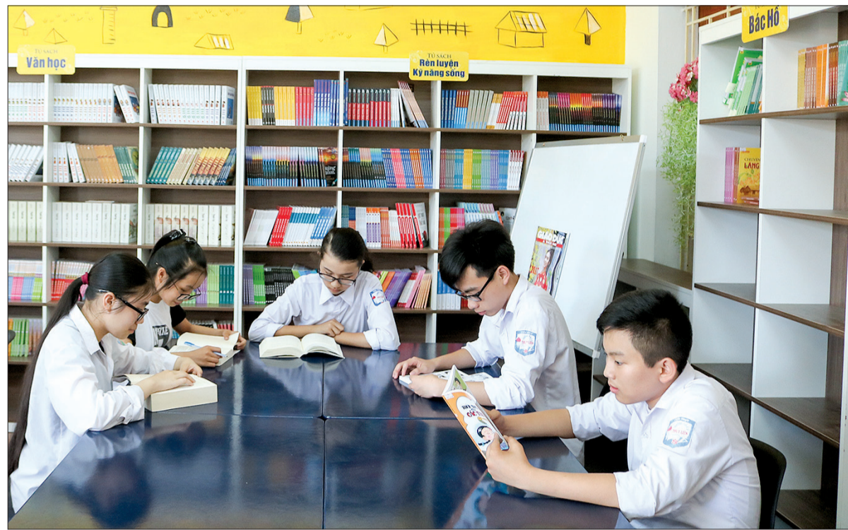
Đọc sách tại thư viện Trường THCS Thụy Liên (Thái Thụy).

Hòa cùng niềm vui của học sinh, sinh viên và các thầy cô giáo trong cả nước, hôm nay, gần 400.000 học sinh Thái Bình bước vào năm học 2018 - 2019 trong niềm hân hoan, náo nức.