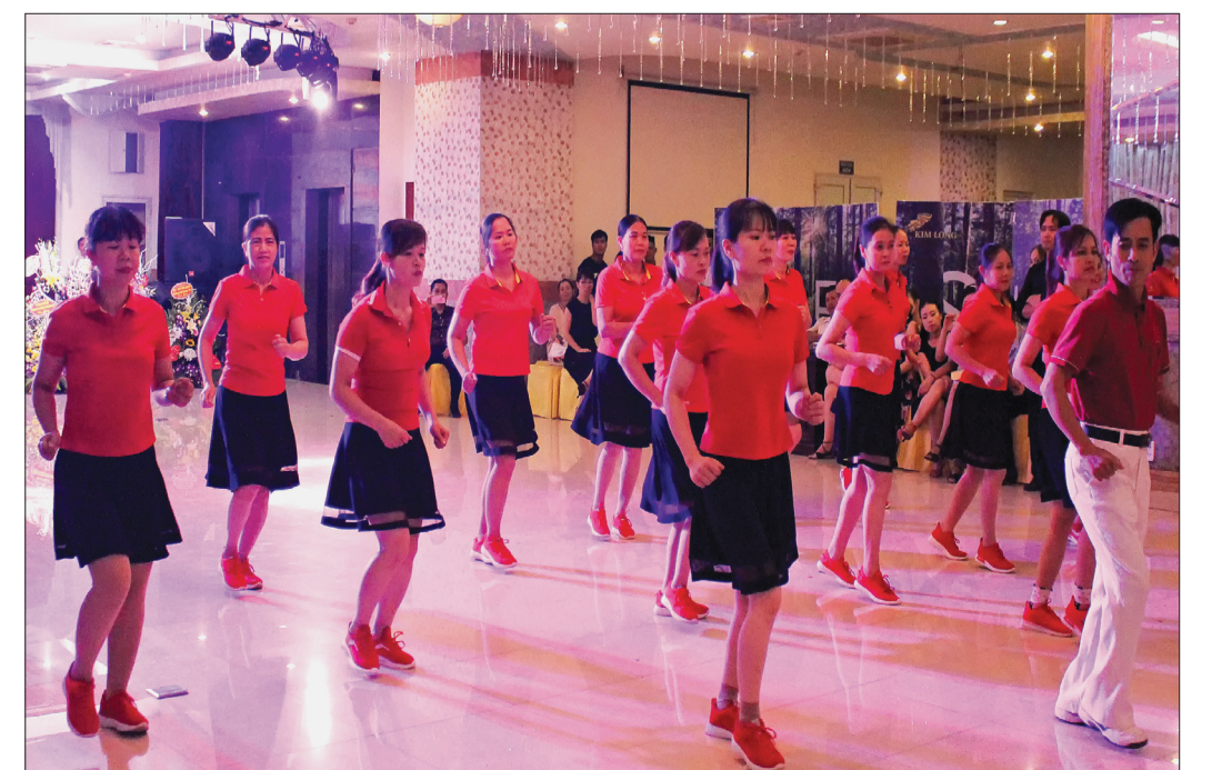
Câu lạc bộ khiêu vũ thể thao xã Phú Lương (Đông Hưng) giao lưu tại thành phố Thái Bình.