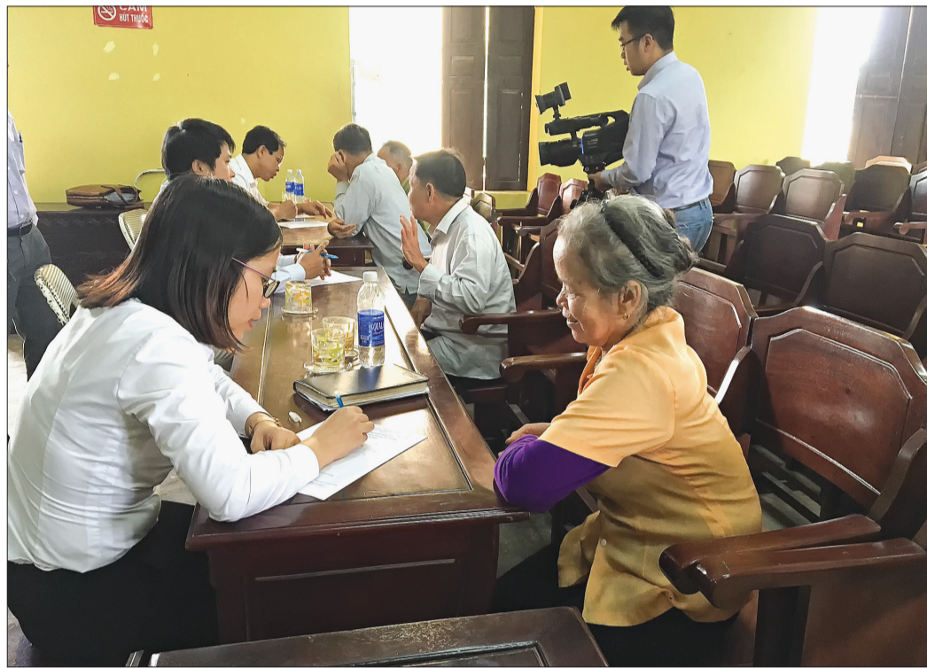
Hoạt động trợ giúp pháp lý tại cơ sở.

Ngày 9/2/1999, Trung ương Hội Luật gia Việt Nam có quyết định công nhận Hội Luật gia tỉnh Thái Bình, đây là dấu mốc quan trọng tập hợp những người đã và đang làm công tác pháp luật trong các cơ quan nhà nước, tổ chức chính trị - xã hội, tổ chức kinh tế, tổ chức văn hóa, tổ chức xã hội, đơn vị vũ trang trên địa bàn tỉnh tự nguyện hoạt động cho sự nghiệp xây dựng và bảo vệ Tổ quốc, bảo vệ quyền lợi hợp pháp của nhân dân, góp phần xây dựng nền khoa học pháp lý, xây dựng nhà nước pháp quyền xã hội chủ nghĩa Việt Nam, vì mục tiêu dân giàu, nước mạnh, dân chủ, công bằng, văn minh.