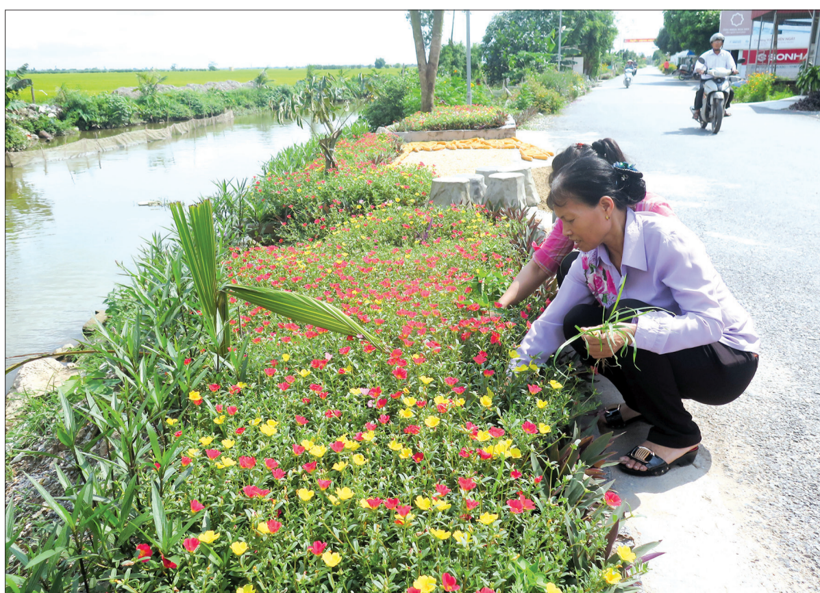
Đường hoa ở xã Vũ Công (Kiến Xương).

Miền là hoa, thấy đẹp là đưa ra đường trồng; không ai biết tên chính xác của hoa là gì nhưng đều khẳng định cứ làm cho đẹp đường, đẹp xóm thay đổi diện mạo ở các vùng quê bằng những con đường hoa rực rỡ trải khắp xóm làng.