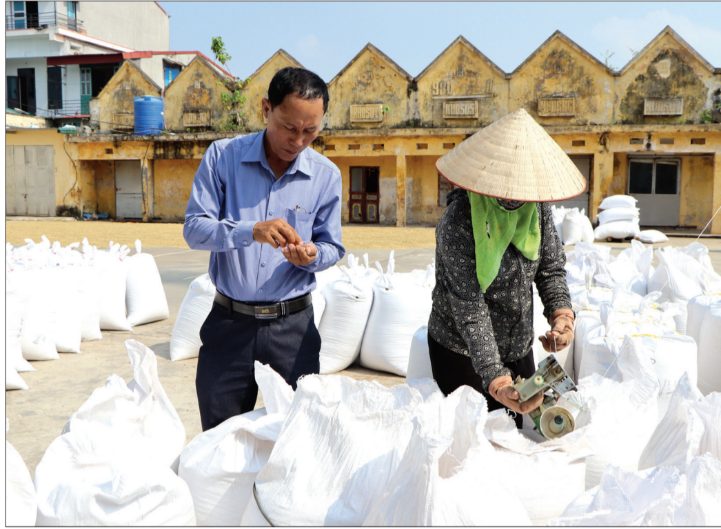
HTX Thương mại dịch vụ và tiêu thụ nông sản xã Bình Định (Kiến Xương) mỗi năm tiêu thụ trên 2.500 tấn thóc cho người dân.

Dù năm 2024 chịu nhiều tác động của thiên tai, ngành nông nghiệp Kiến Xương vẫn duy trì hiệu quả nhiều mô hình đặc trưng, làm tiền đề để năm 2025 tiếp tục chuyển đổi tư duy sản xuất và hình thành thêm những mô hình mới.