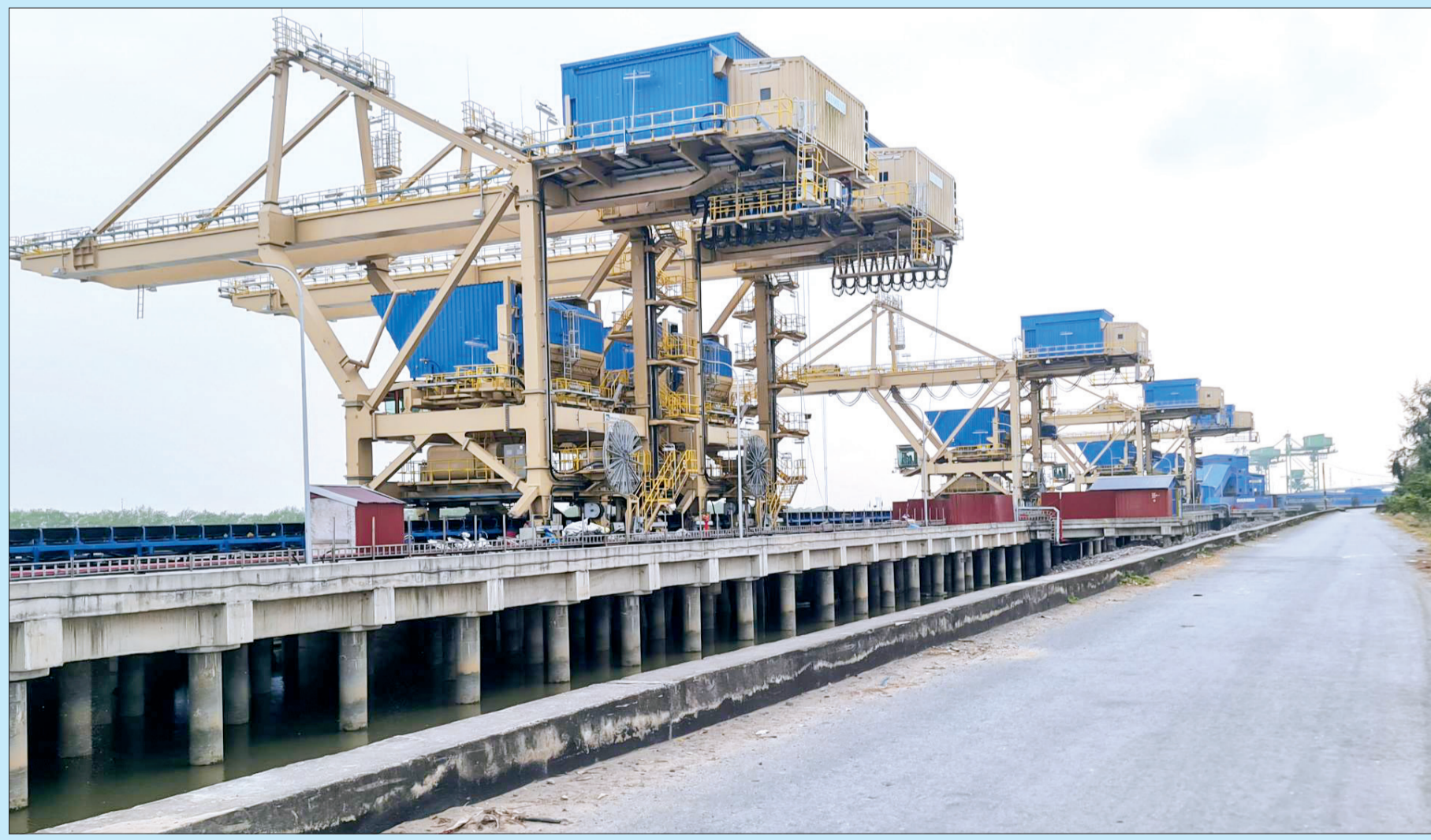
Nhà máy nhiệt điện Thái Bình 2 đang gấp rút hoàn thiện để đi vào hoạt động.