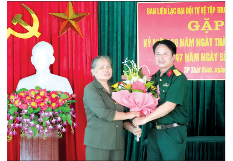
Lãnh đạo Ban CHQS thành phố Thái Bình tặng hoa chúc mừng.

Sau khi chiến tranh kết thúc, phát huy truyền thống đơn vị, những năm qua, cán bộ, chiến sĩ của đơn vị đã hằng hái tham gia lao động sản xuất, tích cực tham gia các phong trào, hoạt động xã hội tại địa phương; thường xuyên thăm hỏi nhau lúc đau ốm, động viên, giúp đỡ nhau phát triển kinh tế; nuôi dạy con cháu trưởng thành, tiến bộ; xây dựng gia đình văn hóa góp phần xây dựng thành phố Thái Bình ngày càng văn minh, giàu đẹp.