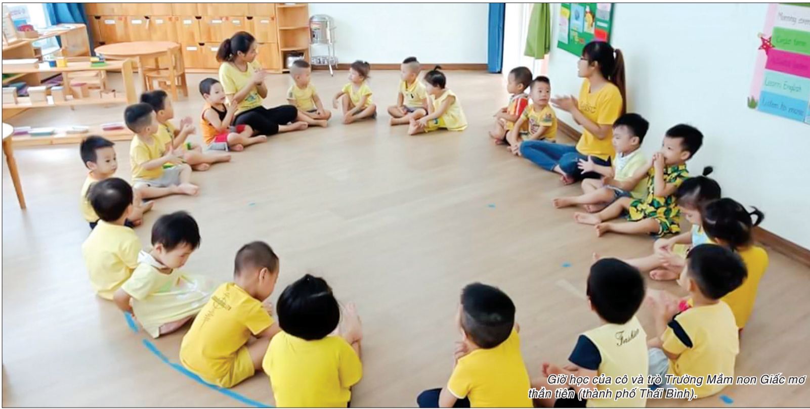
Giờ học của cô và trẻ Trường Mầm non Giác mơ thân tiên (thành phố Thái Bình).