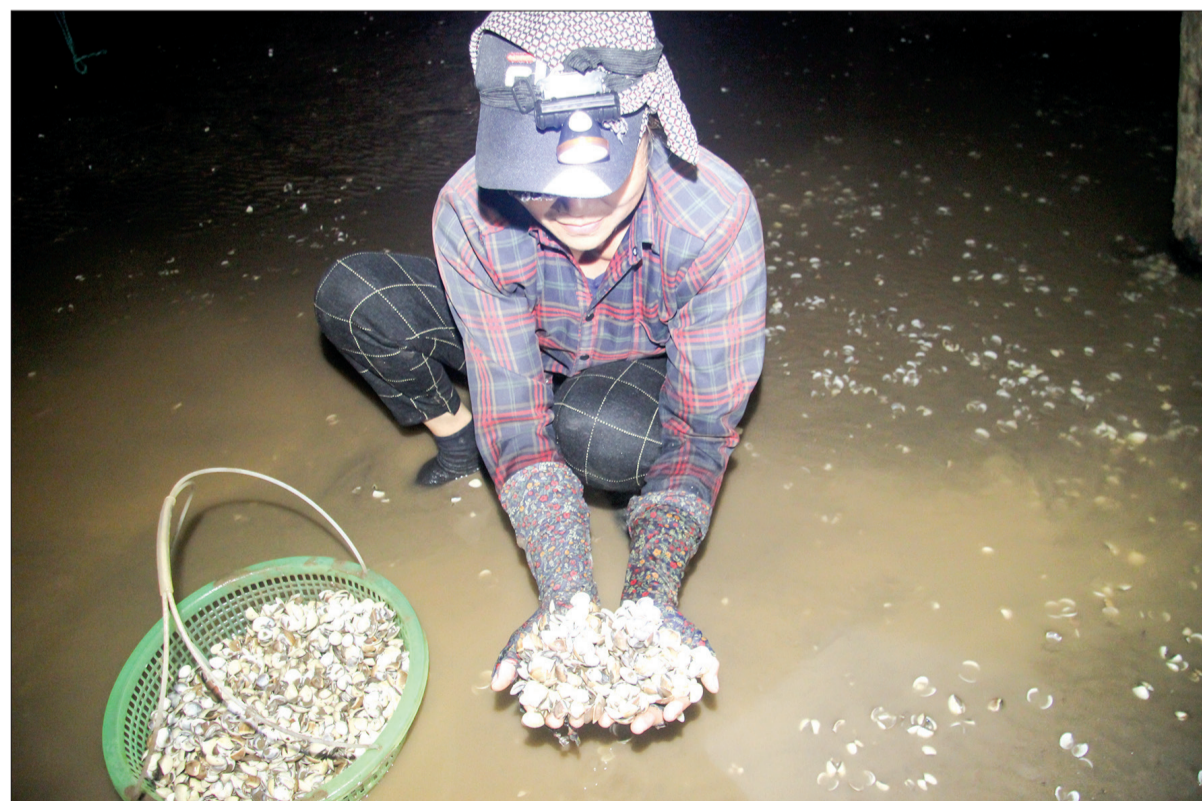
Người dân xã Đông Minh (Tiền Hải) kiểm tra tình trạng ngao chết.

Những ngày qua, trên địa bàn hai xã Đông Minh, Nam Thịnh (Tiền Hải) xảy ra hiện tượng ngao chết hàng loạt khiến nhiều gia đình bị thiệt hại về kinh tế lên đến hàng tỷ đồng.