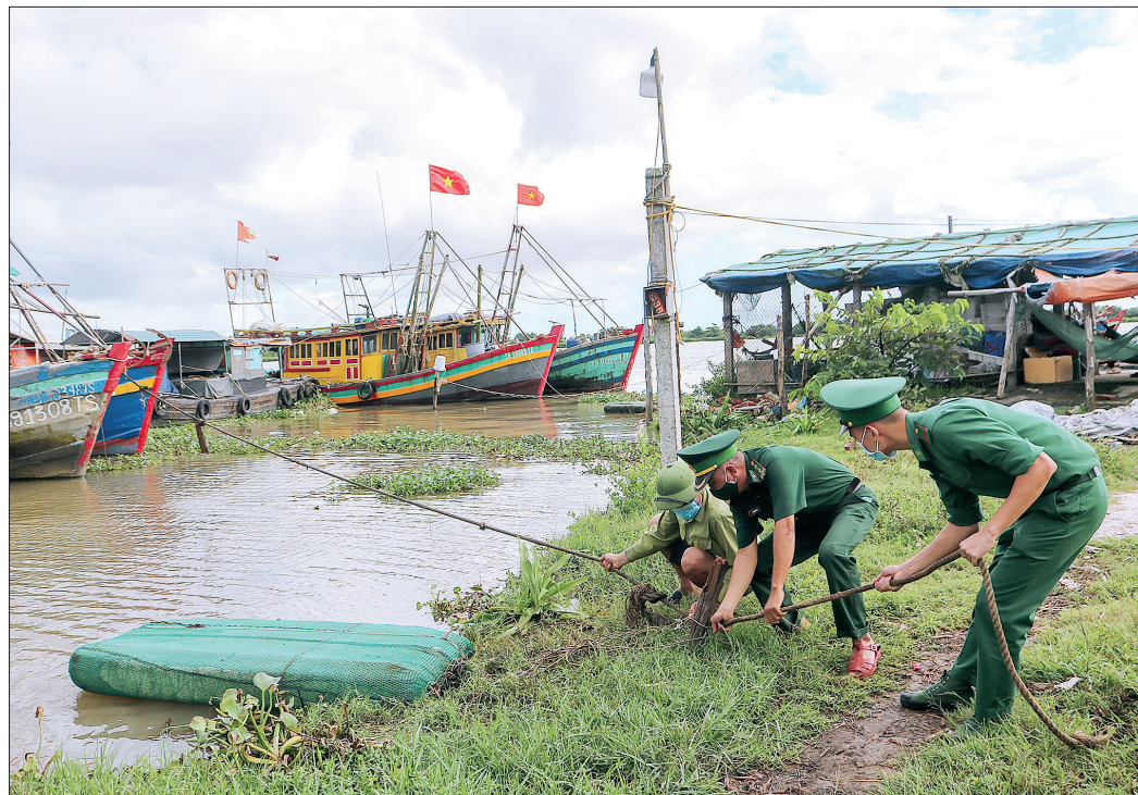
Đoàn viên, thanh niên Đồn Biên phòng Trà Lý hỗ trợ ngư dân neo đậu tàu thuyền tránh trú bão.

Phát huy vai trò xung kích, sáng tạo trong thực hiện nhiệm vụ chính trị của đơn vị cũng như các hoạt động tình nguyện, bằng những phong trào, hoạt động cụ thể, thiết thực, tuổi trẻ Bộ đội Biên phòng (BĐBP) tỉnh đã góp phần bảo vệ vững chắc chủ quyền, an ninh biên giới.