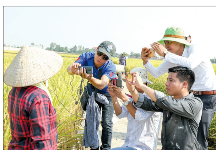
Phóng viên sáng tạo tác phẩm báo chí đa phương tiện tại xã Đông Cường (Đông Hưng).

Suy cho cùng, thì làm nghề gì cũng cần có sự dẫn thân. Song nghề làm báo càng phải có sự dẫn thân mới có được những bài báo đáp ứng sự mong đợi của độc giả. Trong cuộc kháng chiến chống Mỹ cứu nước các phóng viên chiến trường phải bám sát các mũi tiến công của bộ đội để ghi lại những thước phim, những bức ảnh chiến đấu mà không bao giờ có thể lặp lại được. Nhà thơ Lê Anh Xuân đã chứng kiến hình ảnh anh giải phóng quân hy sinh ở sân bay Tân Sơn Nhất trong dáng đứng, để ông cho ra đời bài thơ rất nổi tiếng "Dáng đứng Việt Nam".