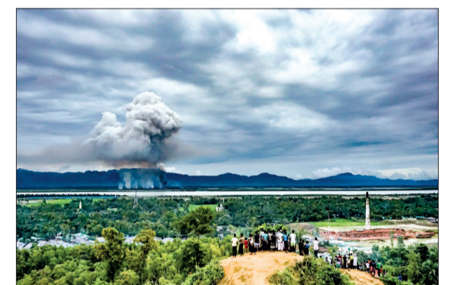
Bức ảnh toàn cảnh ấn tượng về những người dân Rohingya theo đạo Hồi ở bang Rakhine tại khu tái định cư Leda đang nhìn những ngôi nhà họ ở bên kia biên giới Myanmar bị thiêu cháy của Md Masfiqu Akhtar Sohan (Reuters) đoạt giải ba trong hạng mục tin tức General News Singles.