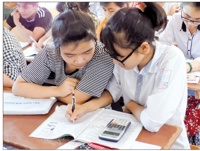
Học sinh Trường THPT Tiên Hưng thảo luận trong tiết ôn tập trên lớp.