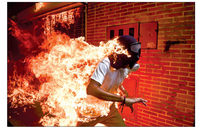
"Cuộc khủng hoảng Venezuela" của Ronaldo Schemidt, phóng viên ảnh người Venezuela (hãng thông tấn AFP), với khoảnh khắc đất giá ngọn lửa bùng cháy trên lưng một người biểu tình trong cuộc đụng độ với cảnh sát ở Caracas, vượt lên trên 73.044 bức ảnh giành giải thưởng lớn của năm.

Người xem có dịp thưởng ngoạn những tác phẩm ảnh báo chí xuất sắc nhất thế giới năm qua và cảm nhận rõ sức mạnh của ảnh báo chí trong thời đại công nghệ số hôm nay. Đây là sự kiện nổi bật trong chuỗi hoạt động kỷ niệm 45 năm thiết lập quan hệ ngoại giao Việt Nam - Hà Lan. Những tác phẩm thắng giải cuộc thi ảnh báo chí thế giới danh giá nhất 2018 do Tập đoàn ảnh báo chí thế giới (World Press Photo Foundation, thành lập từ năm 1955) sẽ được trưng bày. Thông thường, các triển lãm ảnh của WPP lưu diễn tại 100 thành phố ở 45 quốc gia, với Việt Nam đây là lần trở lại sau nhiều năm vắng bóng. Ấn tượng đầu tiên là chiến tranh và xung đột được phản ánh đậm nét. Nhưng nói như giám tuyển (curator) cho triển lãm, "không thiếu nước mắt và nỗi buồn nhưng từ đó vẫn thấy ánh lên niềm hy vọng".