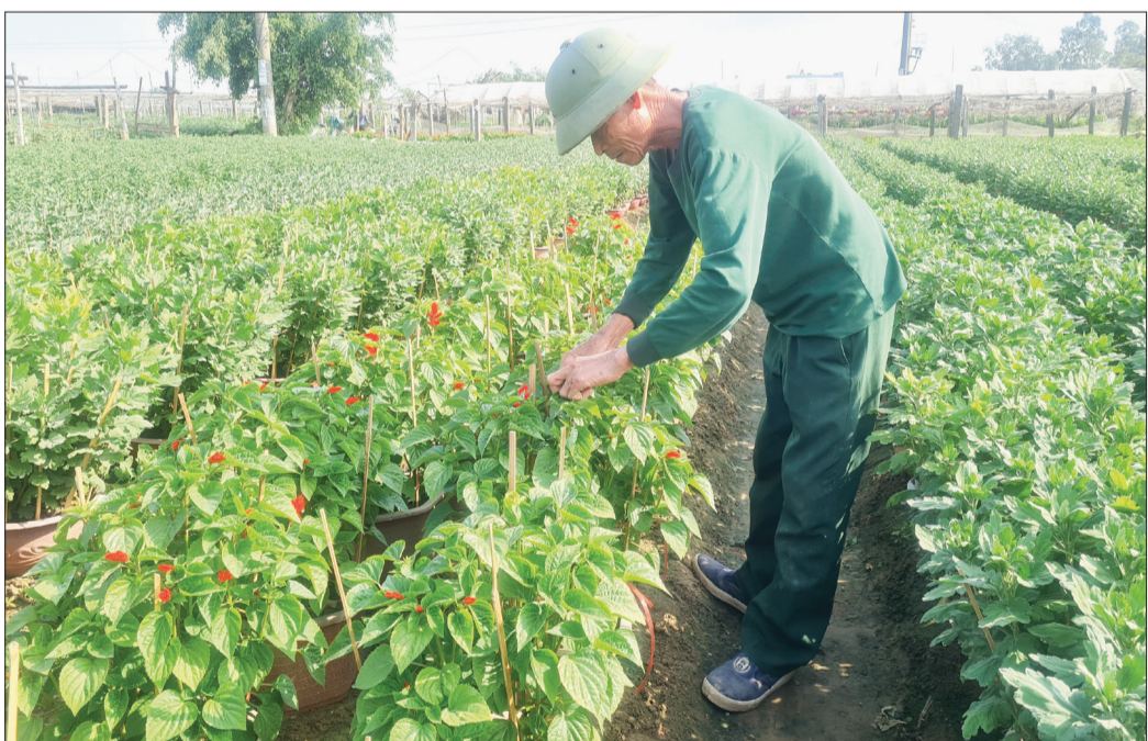
Làng hoa Vũ Chính.