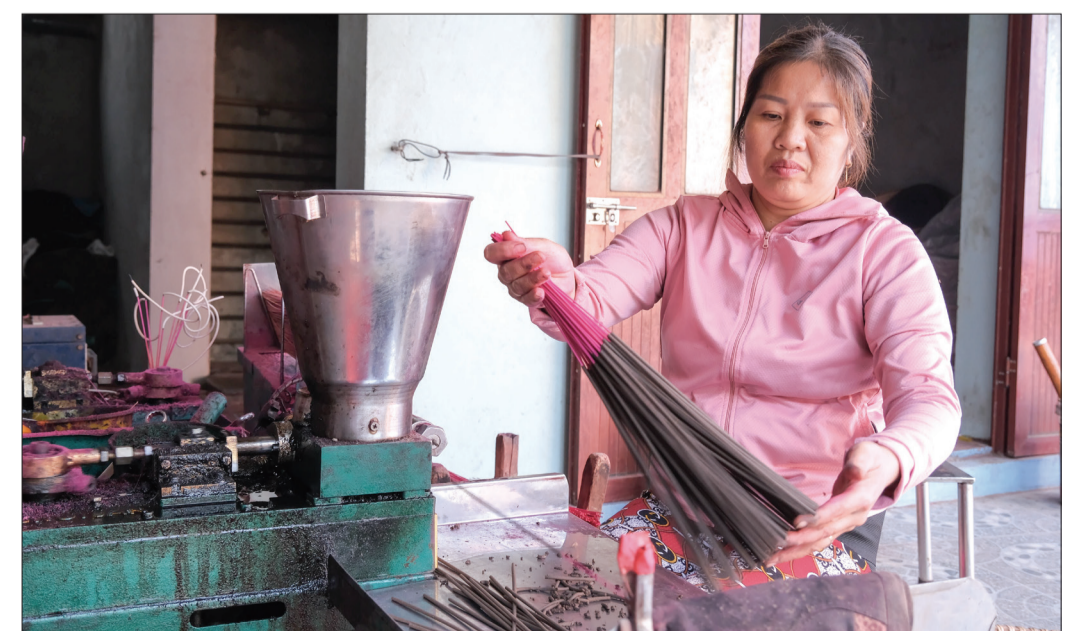
Làm hương bằng máy năng suất cao gấp 4 - 5 lần làm thủ công.