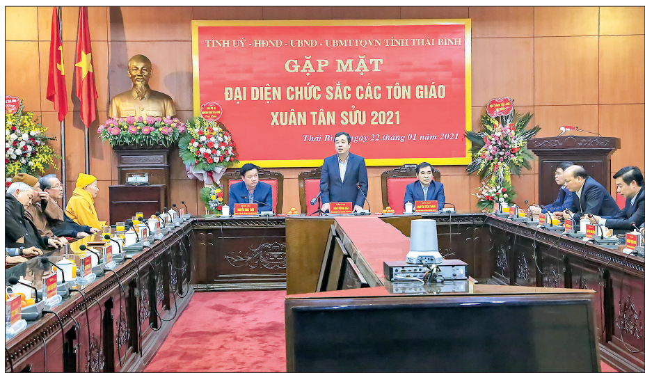
Đồng chí Ngô Đồng Hải, Ủy viên dự khuyết Ban Chấp hành Trung ương Đảng, Bí thư Tỉnh ủy phát biểu tại buổi gặp mặt.