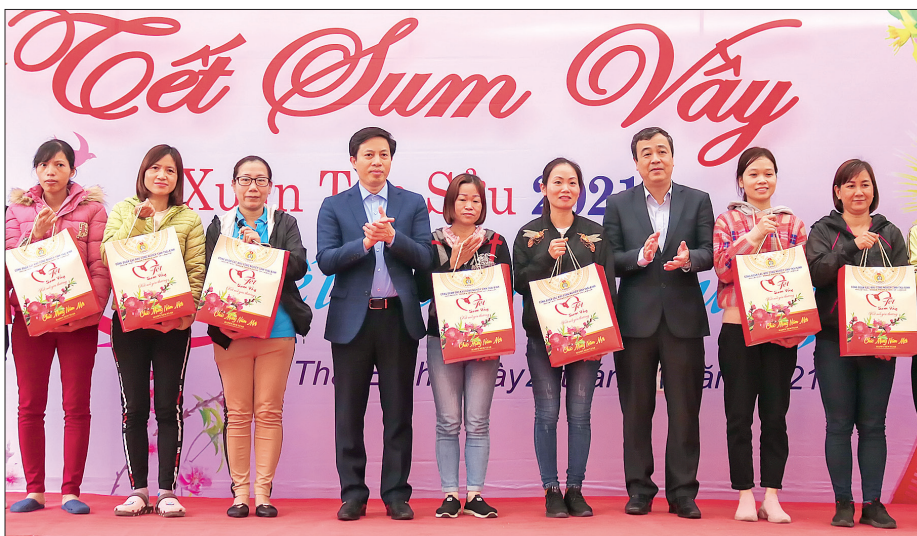
Các đồng chí lãnh đạo tỉnh trao quà tết cho công nhân lao động khu công nghiệp Nguyễn Đức Cảnh, thành phố Thái Bình.