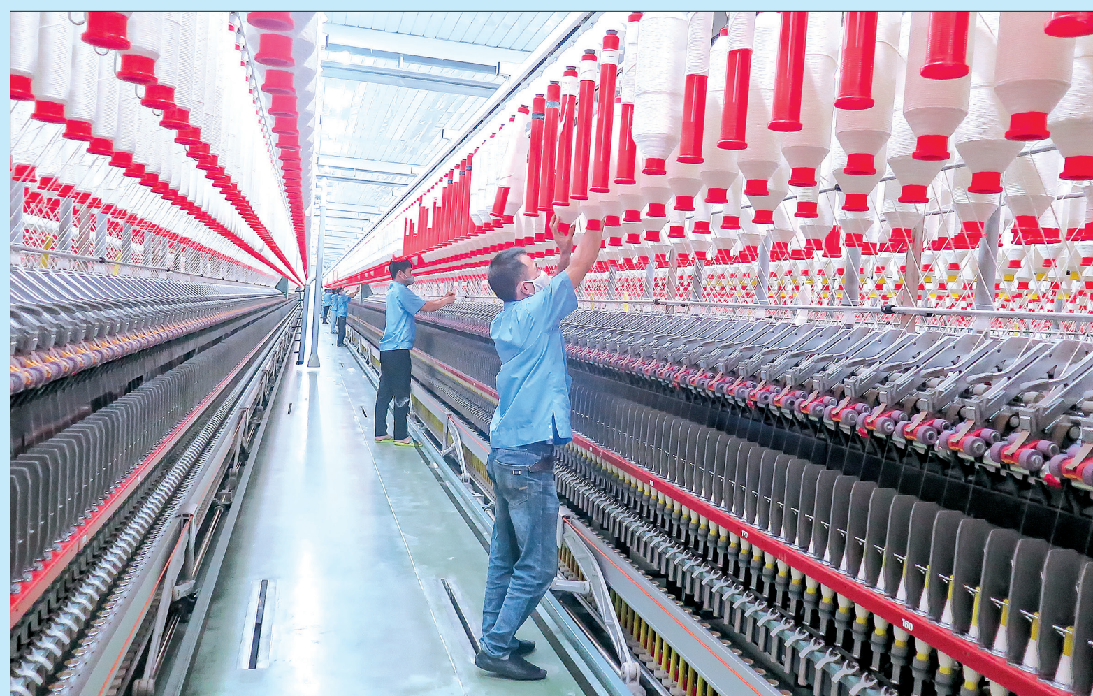
Công nhân Công ty TNHH Sợi dệt Hương Sen Comfor thi đua lao động sản xuất lập thành tích chào mừng Đại hội.