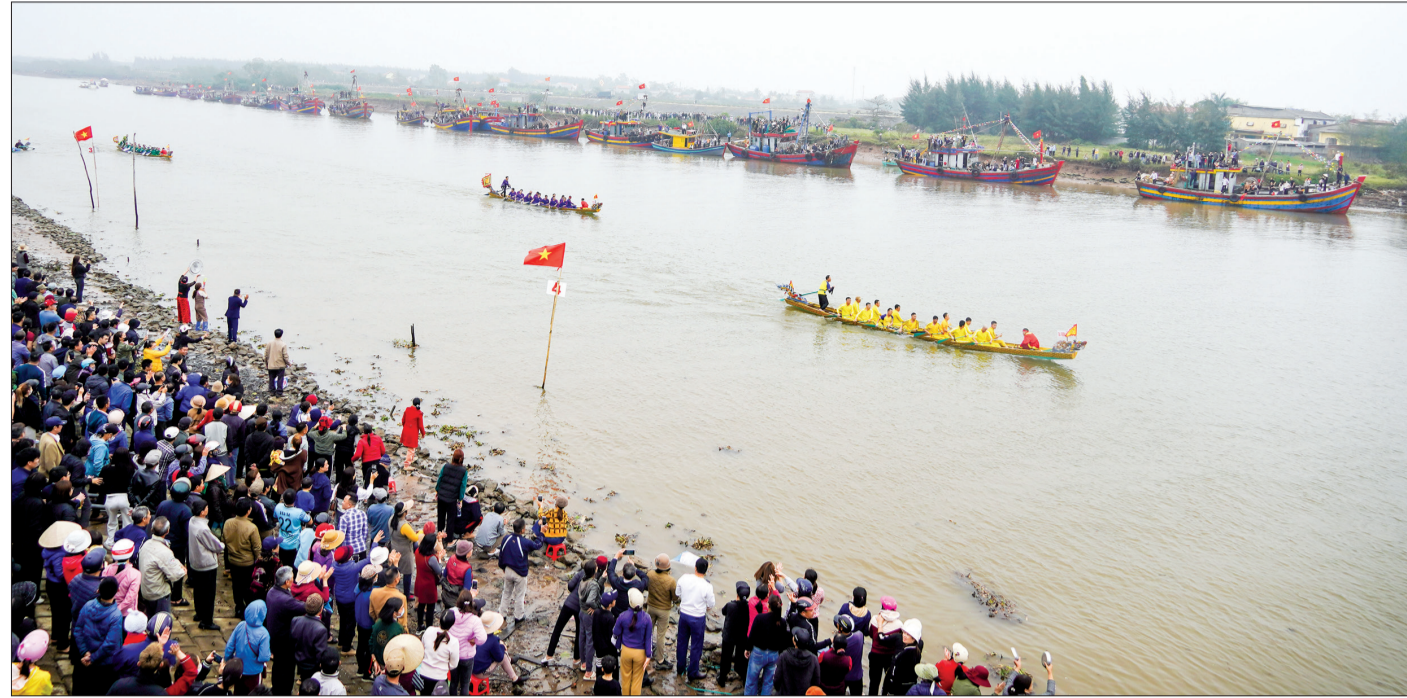
Lễ hội bơi chải truyền thống trên sông Diêm Hộ năm 2024.

Hồ Đội (thị trấn Diêm Điền) và trải bơi xã Thái Thượng. Trên mỗi trải bơi có 15 tay chèo, một người cầm lái và một người hò nhịp, các tay chèo đều có sức khỏe, kỹ thuật tốt. Theo thể lệ cuộc thi, các đội đua tranh