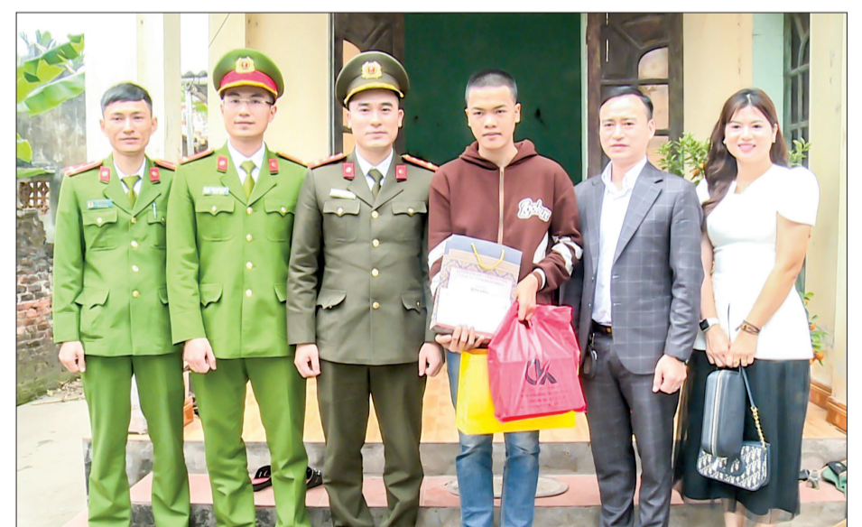
Ban Thanh niên Công an tỉnh tặng quà thanh niên xã Diệp Nông (Hưng Hà) có hoàn cảnh khó khăn tham gia nghĩa vụ Công an nhân dân.

có ích cho xã hội. Đồng chí đề nghị lãnh đạo các địa phương quan tâm đến thanh niên, nhất là những thanh niên có hoàn cảnh khó khăn. Bộ CHQS tỉnh, Ban CHQS thành phố và cấp ủy, chính quyền địa phương sẽ tạo điều kiện tốt nhất để thanh niên các tân binh được hưởng chế độ, chính sách theo quy định để các tân binh yên tâm học tập, rèn luyện, hoàn thành tốt nhiệm vụ trong quân ngũ, góp phần xây dựng và bảo vệ vững chắc Tổ quốc Việt Nam xã hội chủ nghĩa.