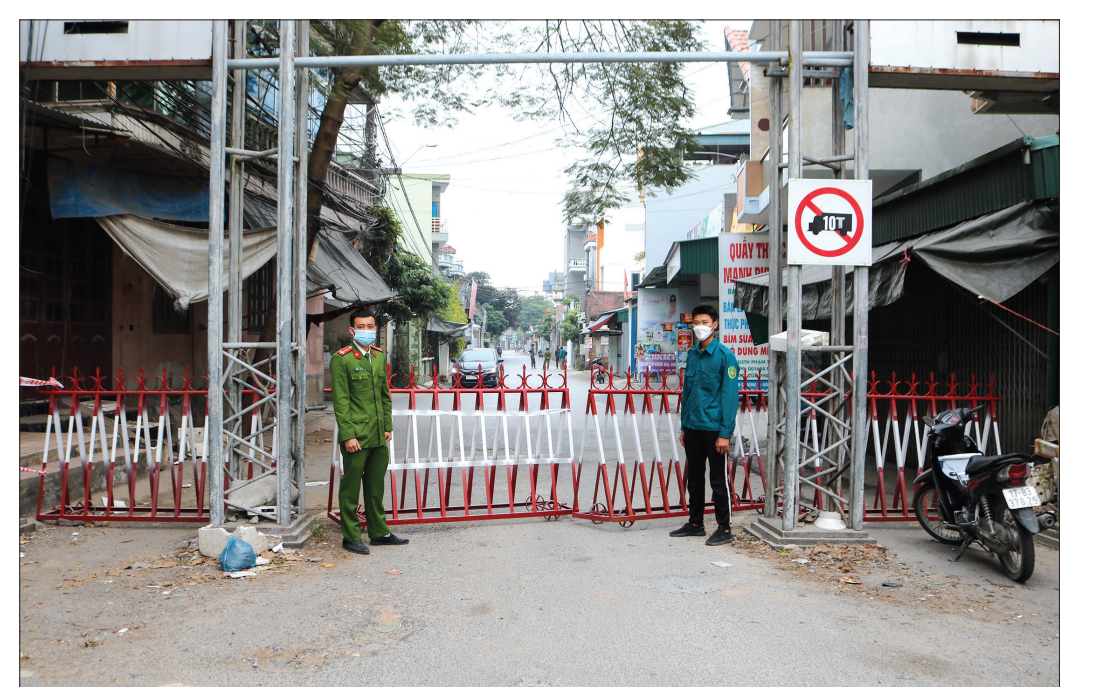
Lực lượng liên ngành thực hiện nhiệm vụ tại chốt kiểm soát phòng, chống dịch Covid-19 trên địa bàn xã Đông La (Đông Hưng).

Đông La là xã giáp trung tâm huyện, lượng người và phương tiện lưu thông qua địa bàn rất lớn gây khó khăn cho công tác phòng, chống dịch. Ông Lại Trí Học, Chủ tịch UBND xã cho biết: Ngay sau khi trên địa bàn xuất hiện các