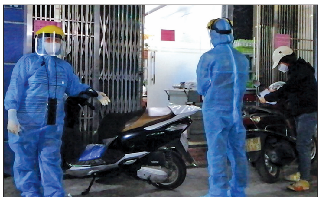
Lực lượng y tế phường Kỳ Bá tổ chức truy vết các F1 ngay trong đêm.